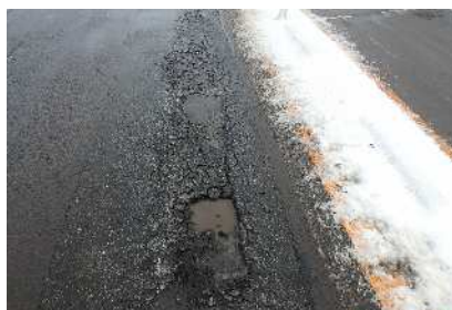
路面損傷状況(拡大)