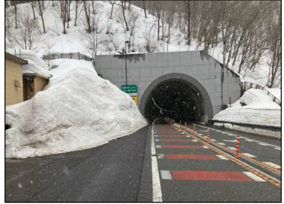
田麦俣トンネルの雪堤