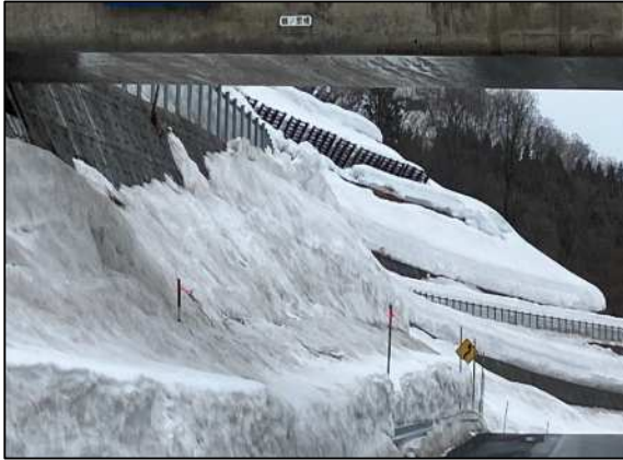
湯殿山 IC ランプの雪堤