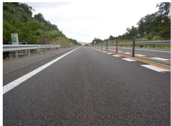
舗装補修後イメージ