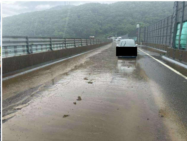
(E8 北陸自動車道 名立橋)