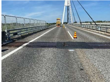
伸縮装置損傷状況

東水戸道路 東行 水戸大洗IC⇒ひたちなかICにおいて、伸縮装置の補修工事を実施します。 安全・快適に高速道路をご利用いただくために必要な工事ですので、ご理解とご協力をお願い致します。