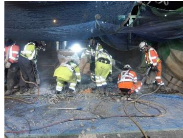
伸縮装置補修工事 作業状況