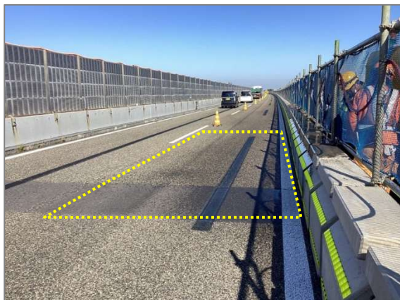
油の飛散時の状況

高速道路本線上の追越車線側の規制内にて工事中、工事で使用しているクレーン車の作動油が車線側に飛散する事象が発生いたしました。