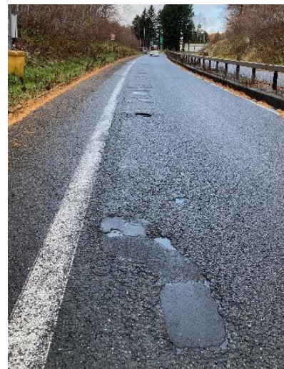
千歳IC入口 舗装の損傷状況

※各路線に付している E5 等の表示は、高速道路等の路線番号(ナンバリング)を示しています。