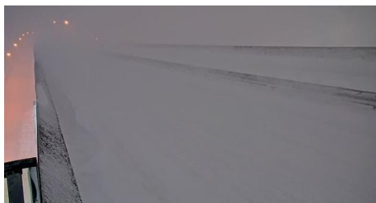
札幌自動車道 新川IC付近