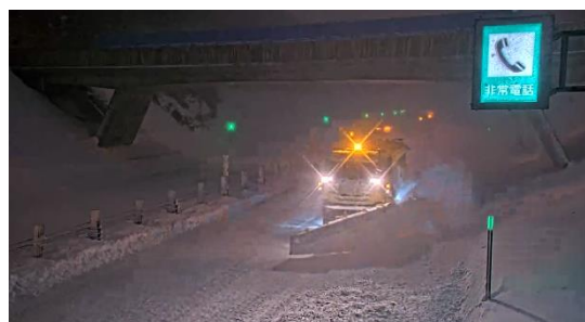
道央自動車道 江別西IC～江別東IC