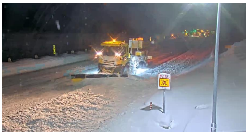
道央自動車道 滝川IC～深川IC