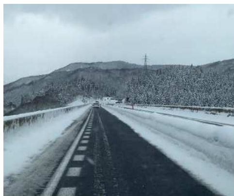
暫定2車線区間における 中央分離帯堆雪状況