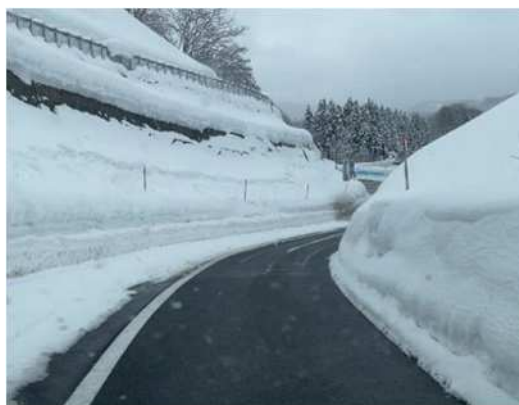
湯殿山ICランプの堆雪状況