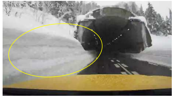
トンネル持ち込み雪発生状況((上)210.0KP付近)