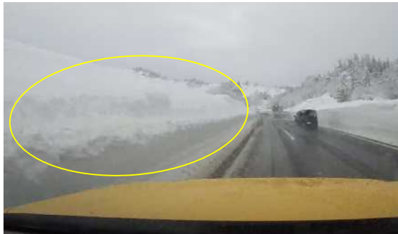
雪庇発生状況((上)203.0KP付近)