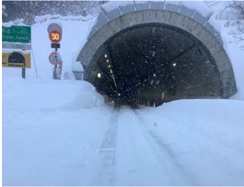
トンネル坑口付近堆雪状況