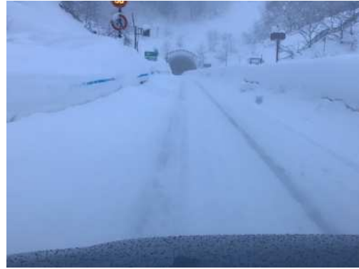
本線中央分離帯堆雪状況