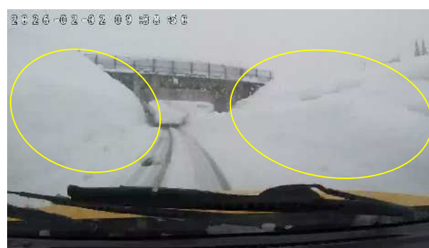
雪庇発生状況(長岡IC・堀之内IC)