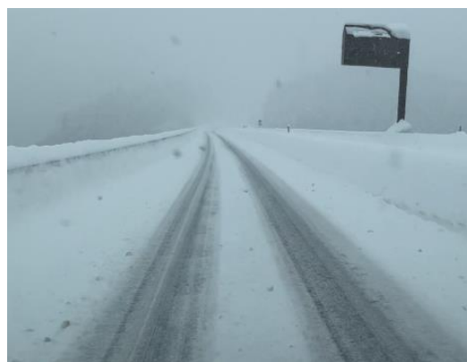
暫定2車線区間における 中央分離帯堆雪状況