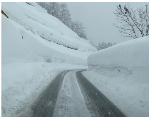
湯殿山ICランプの堆雪状況