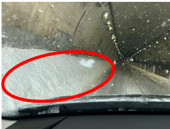
トンネル坑口雪提処理