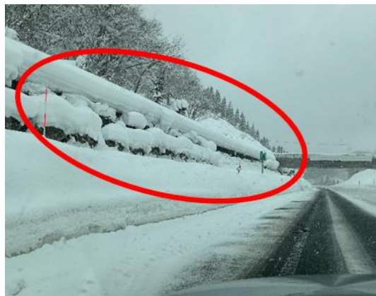
のり面の雪堤処理