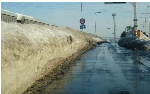
排雪作業後の路肩状況