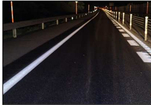
舗装補修後(イメージ)