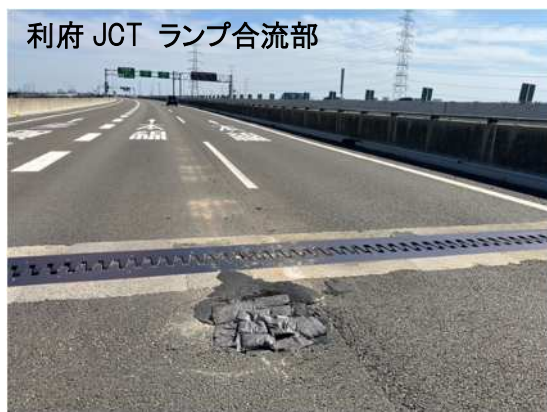
利府 JCT ランプ合流部

北部道から三陸道 いわき方面へ向かう利府JCTのランプ合流部において、路面の損傷が発生しているため、舗装補修工事を実施します。工事実施にあたって通常の車線規制では施工が出来ないことから、ランプを閉鎖して作業を行う必要があります。お客さまへ極力ご迷惑をおかけしないよう、交通量が少ない平日の夜間にランプの閉鎖を行い、工事を集中的かつ効率的に実施します。安全・快適に高速道路をご利用いただくために必要な工事ですので、ご理解とご協力をお願いします。