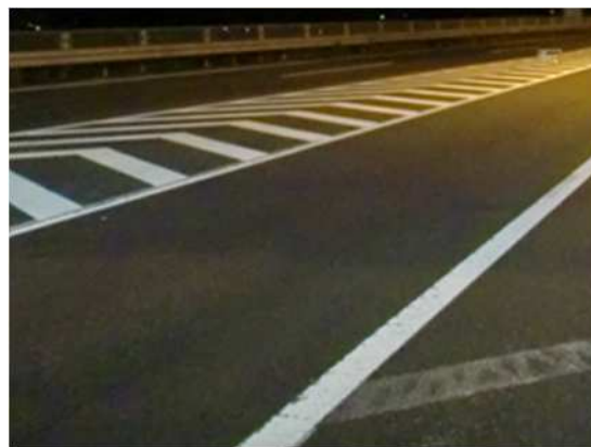
舗装補修後イメージ