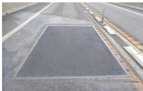
舗装補修イメージ