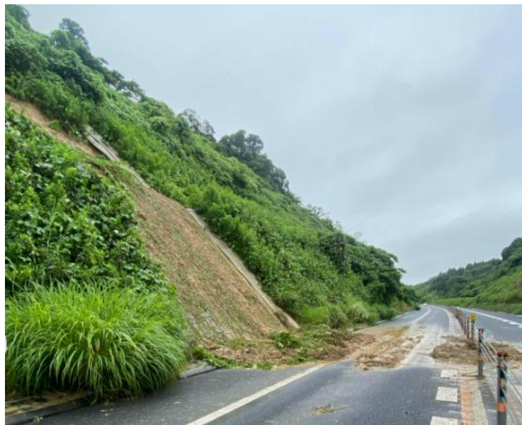
のり面の土砂流出状況(茂原北IC～茂原長南IC間)

高速道路をご利用のお客さまにはご迷惑をお掛けしますことをお詫び申し上げます。引き続き、高速道路をご利用されるお客さまは、お出かけの前に最新の気象予報・道路交通情報をご確認いただきますようお願いいたします。