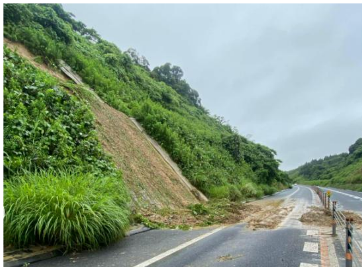
のり面の土砂流出状況(茂原北IC～茂原長南IC間)

高速道路をご利用のお客さまにはご迷惑をお掛けしますこととお詫び申し上げます。引き続き、高速道路をご利用されるお客さまは、お出かけの前に最新の気象予報・道路交通情報をご確認いただきますようお願いいたします。