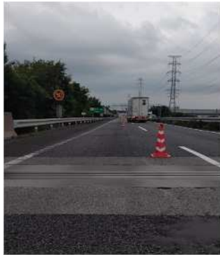
伸縮装置補修工事 損傷状況(遠景)

圏央道 内回り 川島IC⇒坂戸ICにおいて、伸縮装置の緊急補修工事を実施します。安全・快適に高速道路をご利用いただくために必要な工事ですので、ご理解とご協力をお願い致します。