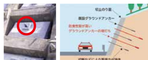
対策工事イメージ

※グラウンドアンカーとは、切土のり面が変形状しようとする力を、高強度の鋼棒等を打ち込むことで安定させるものです。