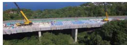
床版取替工事の実例

耐久性の高いコンクリート床版へ取り替えます。 ※床版とは、橋梁を通行する自動車等を直接支え、その荷重を桁へ伝達させる構造部材のことです。