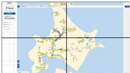
管内地図(ブラウザページ)