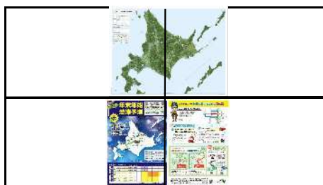
2画面別表示(横分割)