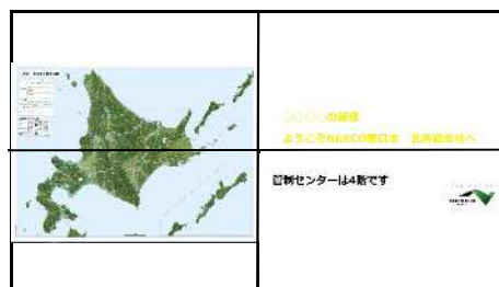
2画面別表示(縦分割)