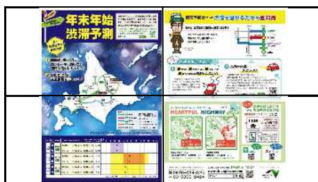
デジサイポスター(PDF)