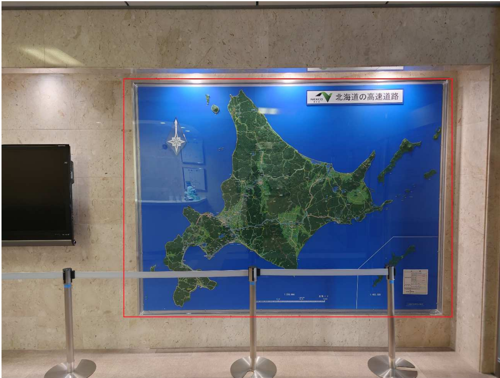
取り外し予定の既存地図