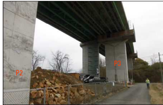
八丁目橋下保管施設