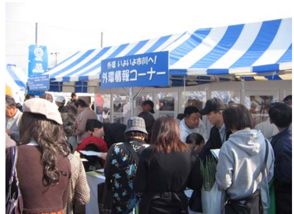
平成21年度 市川市民まつり 外環情報コーナーの様子