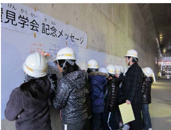
【小塚山トンネル】思い思いのメッセージを書いて貰いました