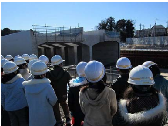
【北総鉄道交差部】この下に鉄道が通っています