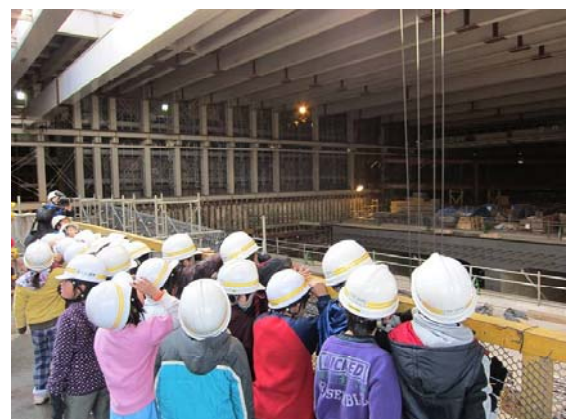
【小塚山トンネル】防音ハウスを体感