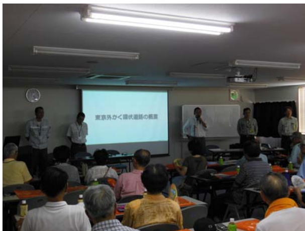
工事の概要を説明しました

千葉工事事務所では今後も、地域イベントへの参加や市民・小中学生を対象とした見学会の開催を通し、地元住民の方々とのコミュニケーションを図っていききたいと思います。