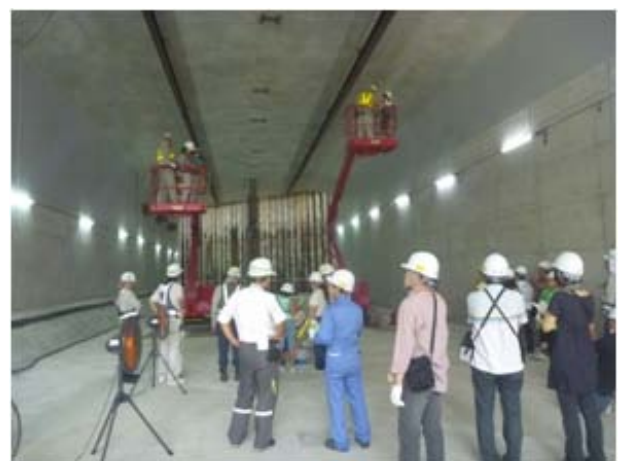
地下の函体を見学