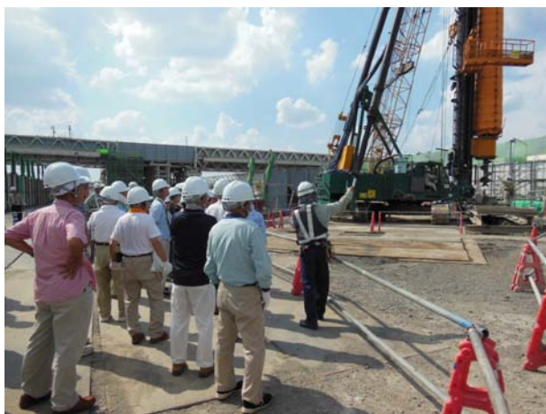
京葉道路に架かる仮橋や迂回状況を見学