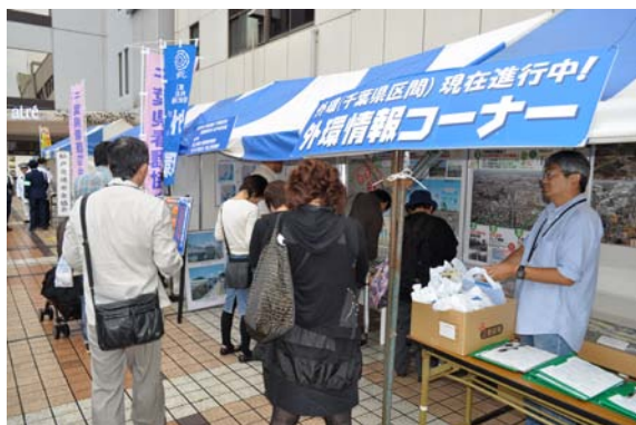
小雨の降る場面もありましたが、多くの方にご来場いただきました

千葉工事事務所および首都国道事務所では今後も、地元住民への情報提供や地域イベントの参加、市民・小中学生を対象とした見学会の開催を通して、多くのみなさまとコミュニケーションを図っていきたく思います。