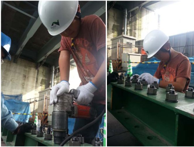
次々とひとりで何本もボルト締め！ マーキングもしっかりと！