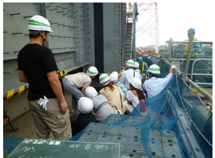
主桁を支える支承について橋脚の上で、現場説明を行いました