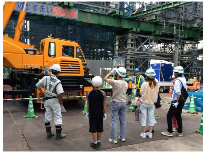
間近で見るクレーンに興味津々！ 「どんな免許が必要なんですか？」等の質問も