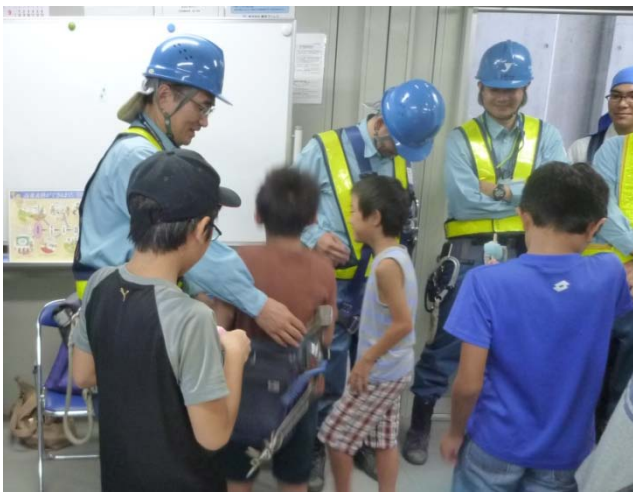
現場の人たちが持っている道具の重さにびっくり！