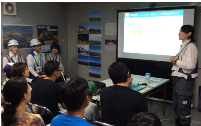
「土木」「高速道路」「橋」について、イラストつきの説明を行いました