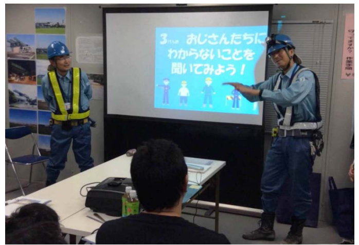
最後にJVのおじさんたちに質問タイム！ なかなか鋭い質問も飛び交います