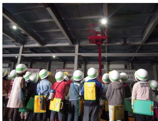
▲高所作業車を見上げています。