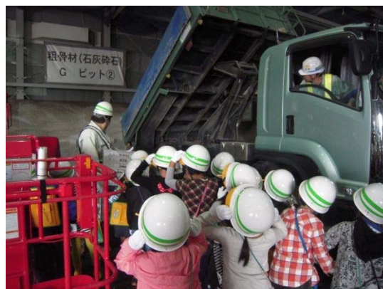
▲コンクリートの材料を運んでいました。