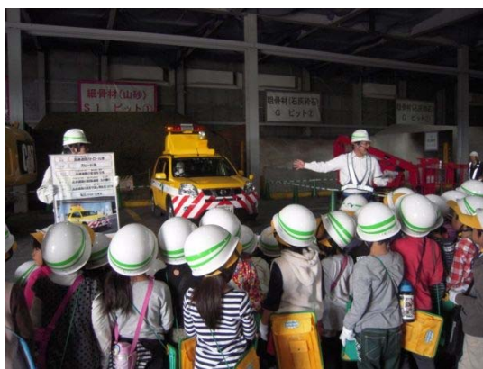
▲たくさんのはたらくくるまを見ることができました。

外環工事について理解を深めていただくために、地域住民の方々や子供たちを対象に千葉工事事務所ではこれからも現場見学会を実施していく予定です。