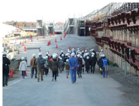
昨年度の見学会の様子

※取材については、後日、記者クラブへの「取材のご案内」で詳細なお知らせをする予定です。