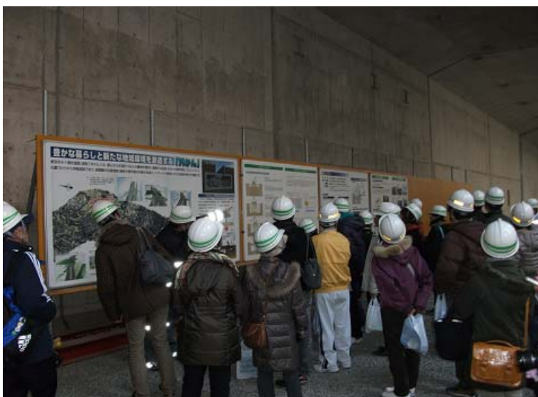
国分地区掘削部試験工事