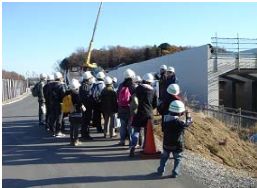
昨年度の外環道路 市民・家族見学会の様子

※記者クラブへの「取材のご案内」については、後日、詳細なお知らせをする予定です。