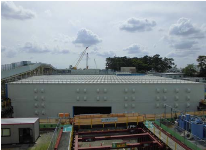
京成本線交差部工事

京成本線の運転終了後の夜間も工事を行うため、作業音が外に漏れないよう、施工箇所を防音用の建物で覆い、工事を進めています。