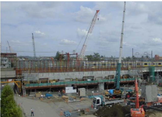
JR総武線交差部工事

京成本線の運転終了後の夜間も工事を行うため、作業音が外に漏れないよう、施工箇所を防音用の建物で覆い、工事を進めています。