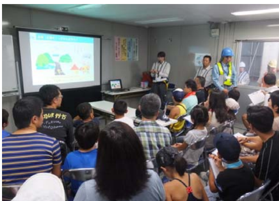
「土木」「高速道路」「橋」について、イラスト付きの説明を行いました。