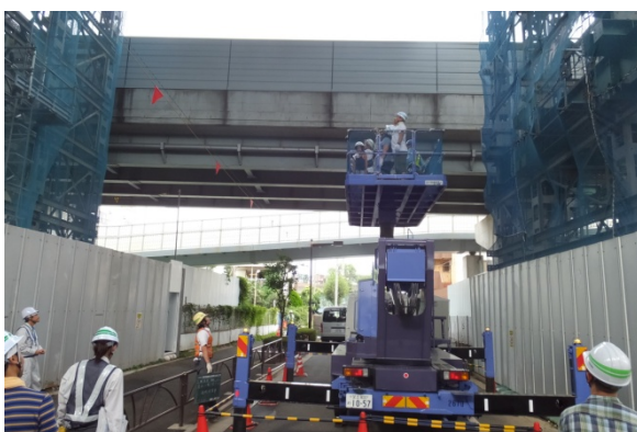
みんなで高所作業車にもチャレンジ！