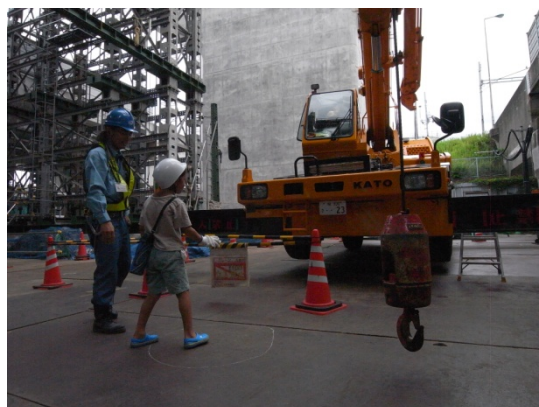
クレーンのオペさんと意思疎通バッチリ！