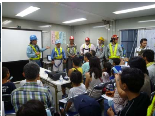
コワモテ！？なおじさん達に質問タイム！冗談を交えた回答に場が和みました。