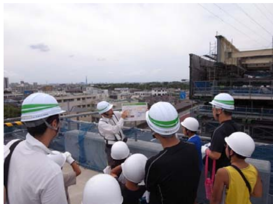
送出し架設を行う橋げたの前で、現場説明を行いました。