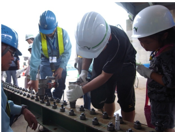
初めてのボルト締めにとどきどき！