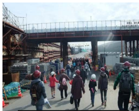
昨年度の見学会の様子

※取材については、後日、記者クラブへの「取材のご案内」で詳細なお知らせをする予定です。