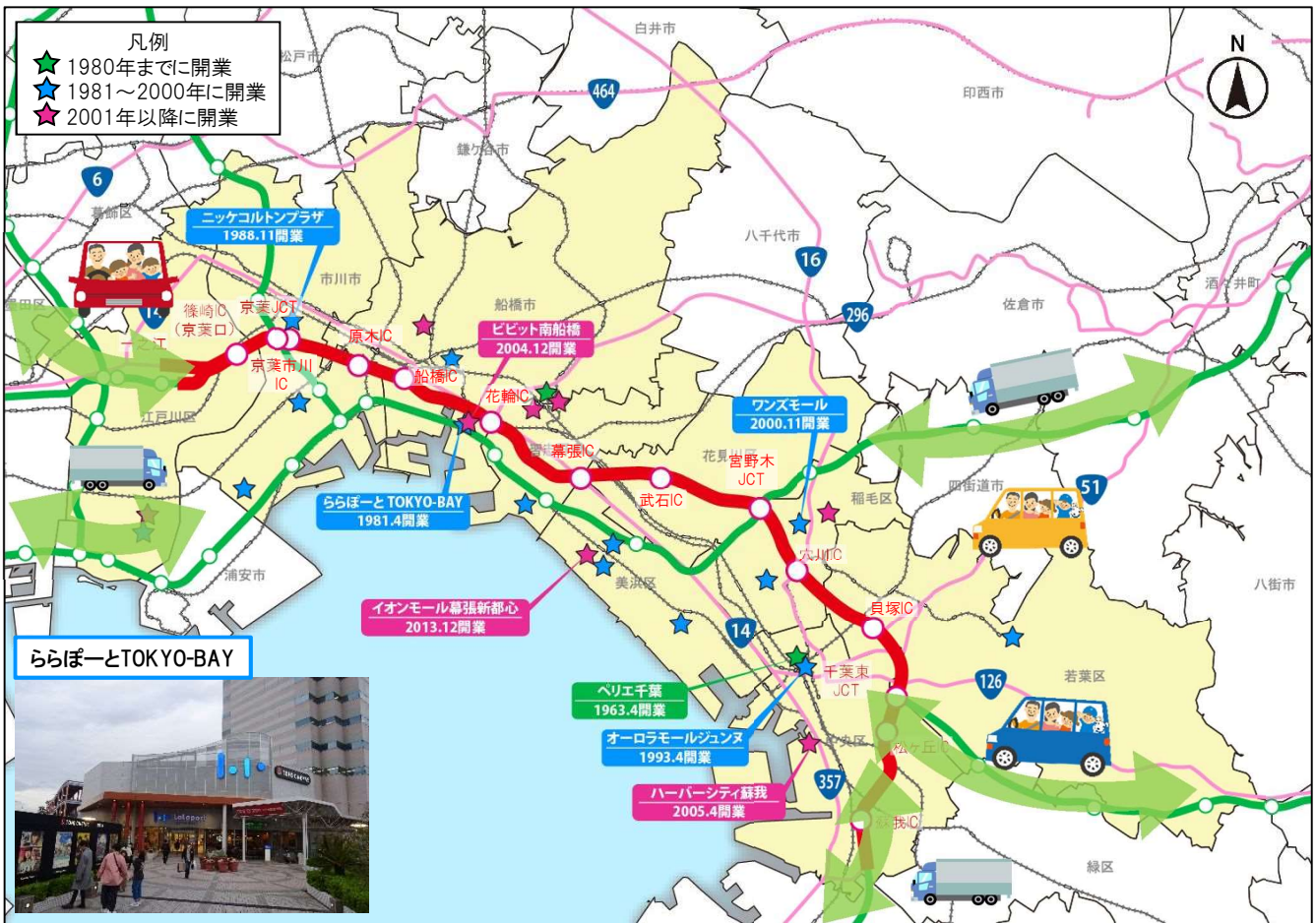
※沿線市区に立地しているショッピングセンターのうち店舗面積2万㎡以上を記入。施設名称は店舗面積5万㎡以上を記入。