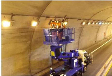
【トンネル内作業状況】