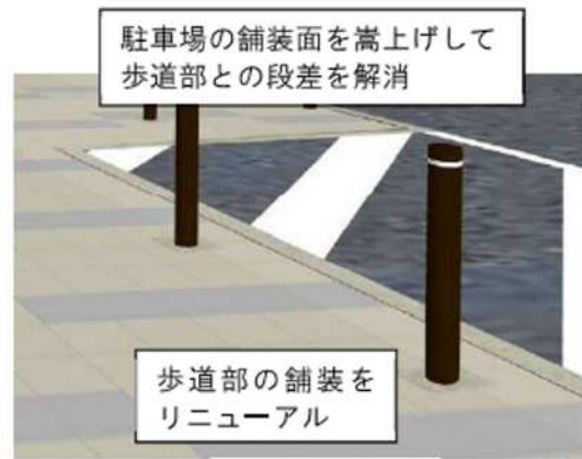
駐車場の舗装面を嵩上げて歩道部との段差を解消