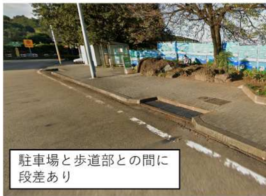
駐車場と歩道部との間に段差あり

安全・快適に高速道路をご利用いただくために必要な工事ですので、ご理解とご協力をお願いします。