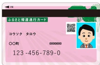
現在ご利用中のカード(桃色) 令和5年10月31日(火)まで