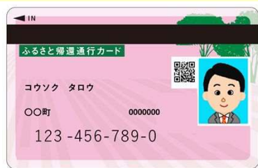
現在ご利用中のカード（桃色） 令和5年10月31日まで