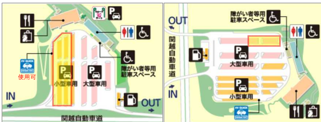
高坂SA 上り線 平面図