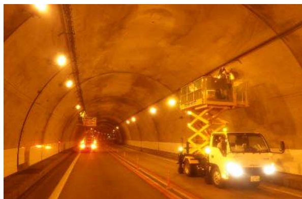
<トンネル設備点検・工事>

安全に走行していただける道路環境を保持するため、トンネル内設備の点検・工事を実施します。