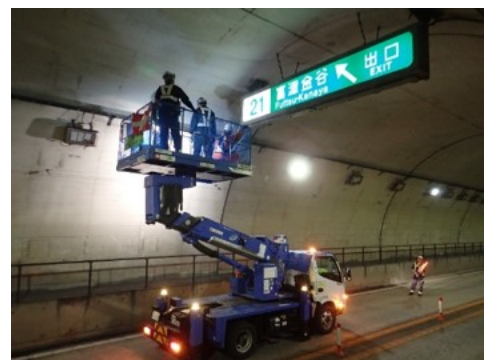
トンネル点検作業状況