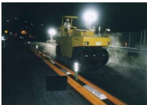
舗装補修作業状況

安全・快適に高速道路をご利用いただくために必要な工事ですので、ご理解とご協力をお願いします。