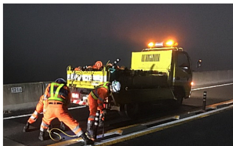
交通管理施設補修 作業状況写真

そのため、お客さまへ極力ご迷惑をおかけしないよう、交通量が少ない平日の夜間に通行止めを行い、工事を集中的かつ効率的に実施します。安全・快適に高速道路をご利用いただくために必要な工事ですので、ご理解とご協力をお願いします。