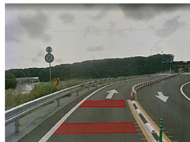
交通事故対策イメージ