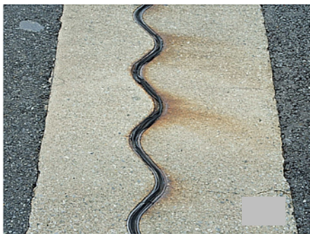
伸縮装置 劣化状況

この工事を行う区間は1車線であり、工事の実施にあたって通常の車線規制では施工ができないことから、ランプ閉鎖して作業を行う必要があります。そのため、お客さまへ極力ご迷惑をおかけしないよう、交通量が少ない平日の夜間にランプの閉鎖を行い、工事を集中的かつ効率的に実施します。安全・快適に高速道路をご利用いただくために必要な工事ですので、ご理解とご協力をお願いします。