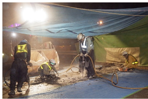
伸縮装置取替作業状況