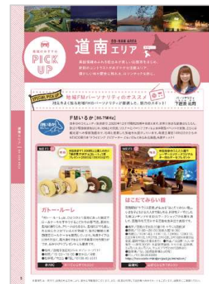
【地域のおすすめスポット】