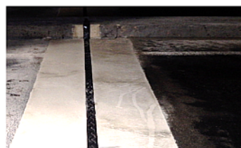
伸縮装置 取替後イメージ