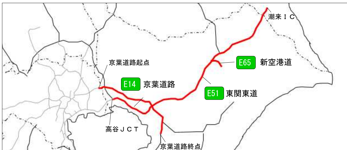
図2 E-ハイラジ実証実験エリア