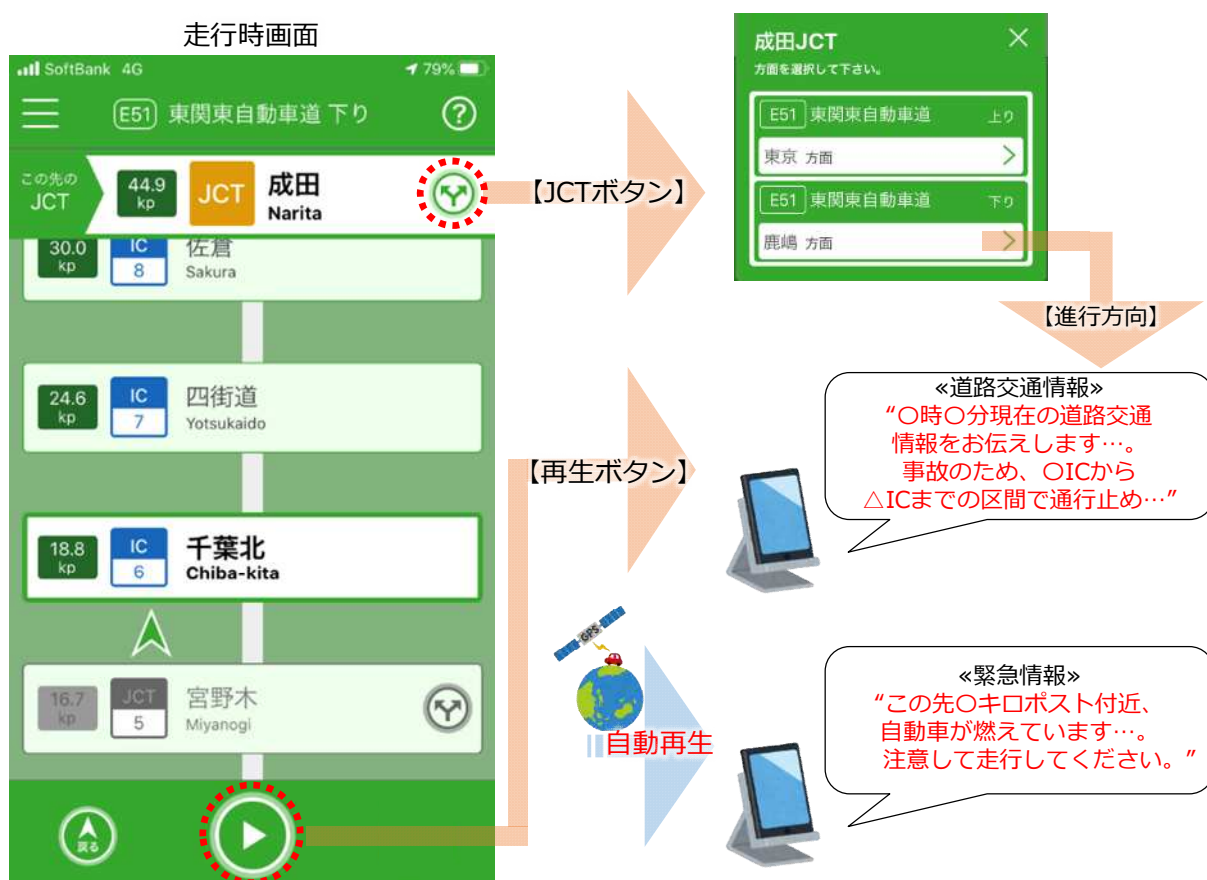
図3 画面操作イメージ