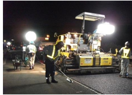
舗装補修工事 作業状況