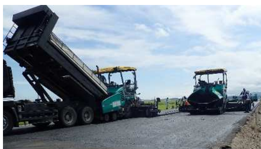
舗装工事(イメージ)