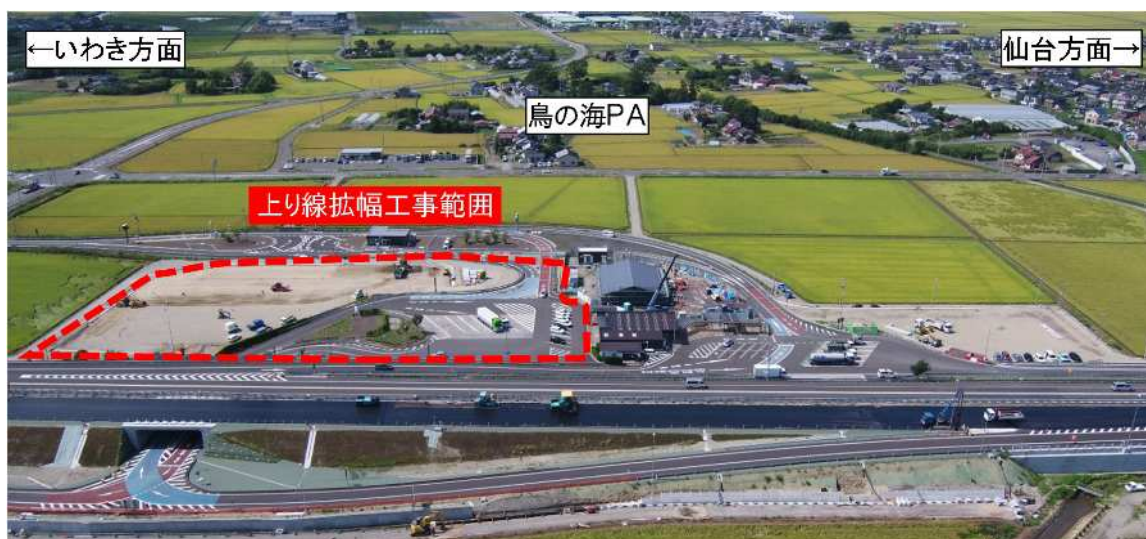
鳥の海PA(上り線)拡幅工事範囲