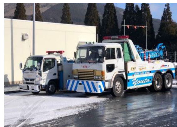
立往生発生時の救出用車両（レッカー車両）の事前配備状況 大分自動車道 湯布院IC