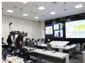
四国地方整備局合同記者会見