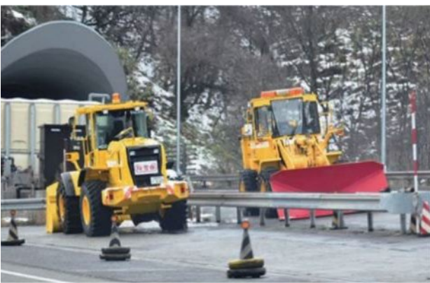
立往生発生時の救出用車両（トラクター・ショベル）の事前配備状況 北陸自動車道 木之本IC～敦賀JCT 高窪トンネル付近