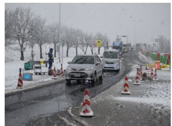
冬用タイヤ・チェーン装着指導状況 北陸自動車道 南条SA