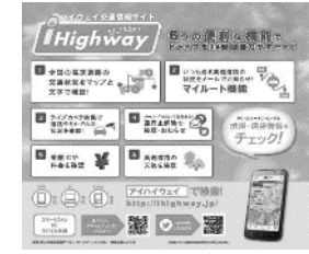
テレビCM、新聞広告による広報 (NEXCO西日本)